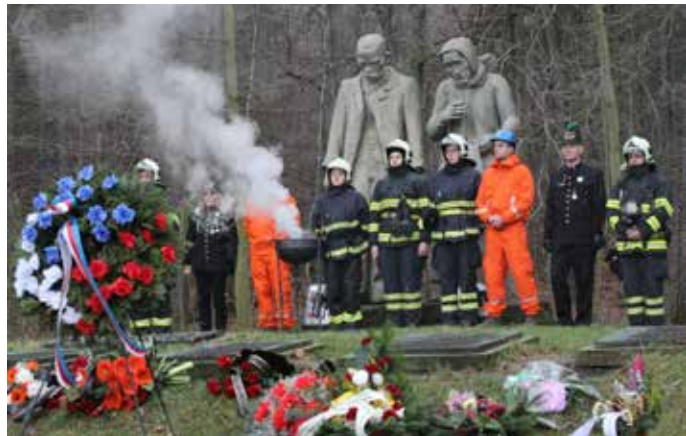
LETOS UPLYNULO od neštěstí 86 let.