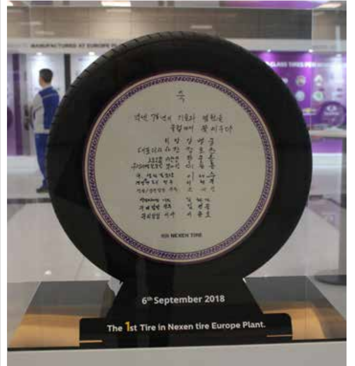
PRVNÍ PNEUMATIKA má v závodě své čestné místo.

Letos chystá světový výrobce pneumatik založení nadačního fondu na ochranu životního prostředí. Podpoří záměry, které se uskuteční v okruhu 40 km od města Žatec.